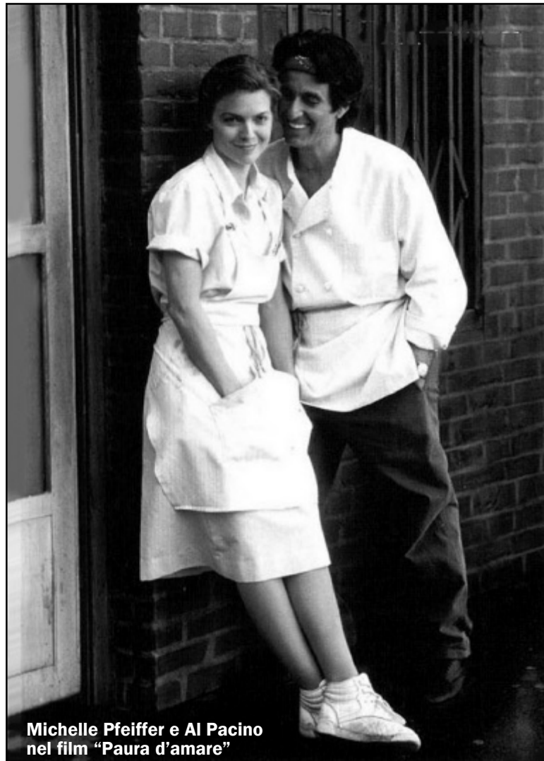
Michelle Pfeiffer e Al Pacino nel film "Paura d'amare"

Molti studiosi si sono soffermati sugli effetti che la "settimana arte" ha sul pubblico, giungendo alla conclusione che non è solo utile per l'approfondimento di certe informazioni, ma è anche un ottimo strumento formativo ed educativo: spinge l'osservatore ad un'intensa partecipazione al fatto rappresentato