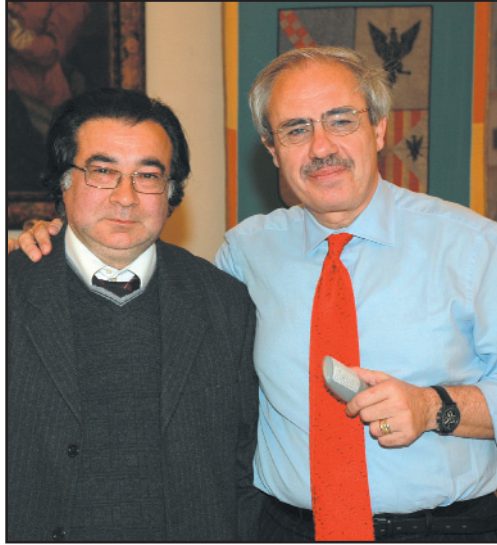
Il Governatore Raffaele Lombardo con Bennardo Raimondi nel corso dell'incontro a Palazzo d'Orleans

Non si può vivere così senza futuro, senza dignità. Devo garantire un minimo alla mia famiglia, e nonostante le ripetute minacce di morte, oggi non mi spavento di nessuno. Mi spavento solo del futuro che lo Stato o le associazioni o altri non garantiscono più a persone che rischiano la vita per il rispetto della legalità. Lascio il mio