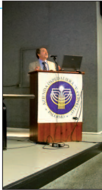
Un momento del convegno

“Una malattia complessa richiede un trattamento altrettanto articolato: ecco perché tutte queste figure devono collaborare tra loro, con le famiglie e i servizi del territorio - continua Piccione -. Lo psicologo ha il ruolo delicatissimo di comunicare ai genitori la diagnosi e informarli sull'evoluzione della malattia, sostenendoli in quelle capacità di cura e protezione che il dolore del figlio mette in discussione. Bisogna poi creare collega-