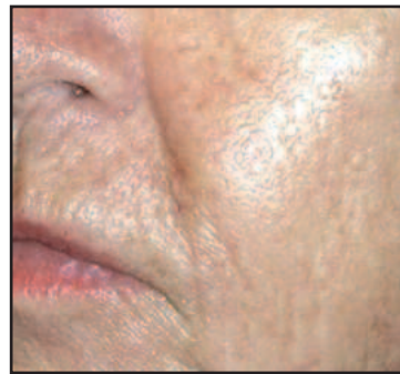
in alto: prima del trattamento sopra: dopo 5 trattamenti