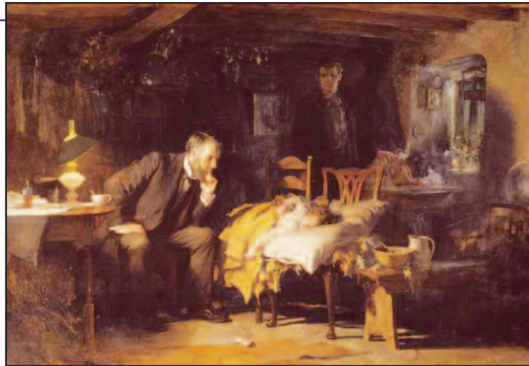
sSir Luke Fildes: Il Dottore (1891)

Il cancro continua a mietere vittime e le terapie, per quanto affinate, continuano ad essere pesanti e spesso infruttuose. Per contro, assisto ad un'impennata degli stili cancerogeni nella popolazione in generale e in quella giovanile in particolar modo, dimostrando un'ottusità, funziona-