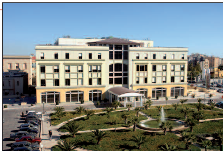
L'Ismett di Palermo, sede del seminario

Il diabete non conosce soste nella sua espansione e, secondo gli ultimi dati, la patologia in tutte le sue forme è aumentata del 41% negli ultimi 5 anni, portando a 500 milioni in più di pazienti entro il 2030. Questi dati sono emersi durante un seminario tenuto di recente dal Prof. Camillo Ricordi presso l'Ismett di Palermo e intitolato "Dalla prevenzione alle terapie avanzate: nuove strategie per affrontare la pandemia di diabete". Secondo gli ultimi studi presentati, un fattore misconosciuto, ma importante per la genesi del diabete di tipo II è l'infiammazione silente, provocata da scorretti stili di vita alimentari. Questa infiammazione si sviluppa sotto la soglia del dolore, dura a lungo e diminuisce la capacità rigenerativa dei tessuti con l'andar del tempo. Infatti, l'introduzione di cibi poco costosi e abbondanti accresce il rischio di sviluppare tale infezione. In questo caso, i meccanismi antiin-