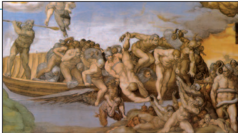
Michelangelo Buonarroti 1475-1564): Il giudizio universale (part.)

riflettere sul destino di questo nostro mondo. Nessun'altra epoca, infatti, è venuta a contatto con la caducità come la nostra. Troppe trasformazioni in pochissimo tempo portano a considerare la vita del nostro pianeta non come l'immutabile sequenza di tempi e di stagioni, ma come risposta a sollecitazioni tante volte improprie. Ciò che è stato sempre uguale per millenni, nel giro di un secolo o poco più si è modificato spesso snaturando tutto. L'uomo camminava tanto, lavorava manualmente, si cibava di prodotti naturali, era a servizio della terra e del clima, lottava anche con essa, ma non poteva far altro che rispettarne la forza. Nulla mutava il corso delle cose. Non si comprende facilmente il motivo del moderno accanimento verso il dominio. La medicina è diventata non solo lotta al male, ma manipolazione fino