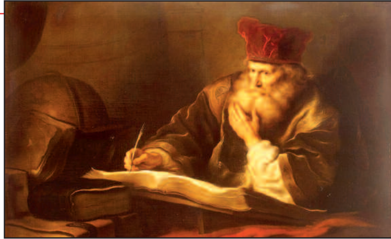
Koninck Salomon (1609 - 1657): Un vecchio studioso