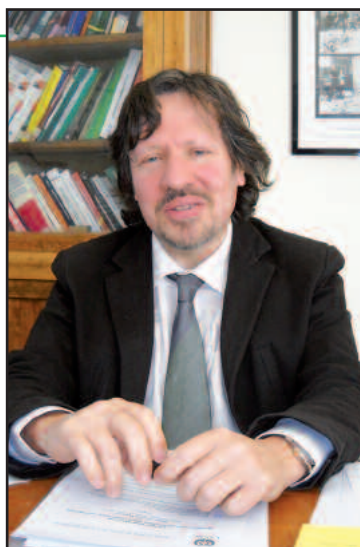
Il Prof. Vincenzo Provenzano

può fare di fronte alla crisi che ha comportato un minore appoggio delle Istituzioni nei finanziamenti. Un altro aspetto è che la Sicilia si presenta come un grande laboratorio, dov'è interessante capire quanto il Terzo Settore ha dimostrato la sua incapacità a risolvere i problemi socio-economici che affliggono la società isoiana. Un esempio è fornito dal coinvolgimento di questo mondo nel micro credito, la cui legge sperimentale è stata approvata di recente. Questa è una forma di credito particolare che presenta due problemi: il primo è la gestione da parte delle banche, che non la considerano diversa dal credito che normalmente si concede ai privati; la seconda riguarda la mancanza di idee, di preparazione e di obiettivi, perché il micro-credito delle famiglie significa non un aiuto per sé, ma serve a stimolare le persone a realizzare una propria attività e a rendersi autonomi. Se non si comprende che è una forma nuova di credito e d'intervento, allora si può tornare al credito bancario secondo i principi classici. Infatti, il credito relazionale è molto diverso, perché il rapporto fiduciario tra persone è diverso. Spesso, il