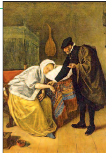
Jan Steen (1626 - 1679): Il dottore e la paziente (part.)

sto alla solidarietà sociale possa evitare di omettere i controlli. Da medico di famiglia, ho sempre pensato che i compiti fiscali verso i soggetti lavoratori dovrebbero in qualche modo essere trasferiti agli specialisti del settore, esautorando dal ruolo certificativo gli altri medici che - vuoi o non vuoi - sono sempre di parte. Quest'anomalia comporta la necessità di operare un controllo sull'operato del collega curante, con un doppiopione alquanto umiliante. Certifica un medico, certifica l'altro sul precedente. Eliminare il doppio passaggio porterebbe ad un'oggettivizzazione della prognosi, in