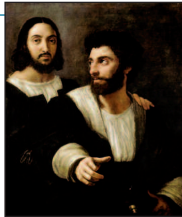
Raffaello (1483 - 1520): Autoritratto con un amico

sperando che una luce illumini la nostra attenzione. Questo accade a tutti noi quando non ascoltiamo amici fidati che mettono in guardia su squilibri dei nostri sistemi interni. Parlo dei sintomi, dei malesseri che improvvisamente o continuamente ci accompagnano. Un modo tipicamente occidentale basato sulle evidenze c'induce a considerarli un accidente, qualcosa di esterno a noi che si frappone al regolare svolgimento della nostra vita fisica. Oggi è certo che un tale modo di vedere è decisamente superato. Il sintomo è un segnale, un suggerimento, una spia luminosa che avver-