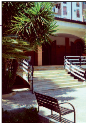
L'ingresso della sede di via Nuova 77/a

personale ed infermieristica h 24, fisioterapia e riabilitazione, assistenza socio-psicologica personalizzata, video sorveglianza costante degli assistiti, animazione e, non ultimi, i servizi sociali attraverso i quali viene particolarmente curata l'accoglienza degli ospiti nelle strutture e garantita una serie di servizi per la tutela dei loro bisogni, della loro salute e dei loro desideri, al fine di assicurare una felice permanenza. Le sei case per anziani sono confortevoli, finemente arredate, dotate di impianto di climatizzazione e di riscaldamento e suddivise in stanze singole, doppie o triple, in base alle richieste degli ospiti. Sempre attenta alle esigenze dei più bisognosi, l'associazione viene incontro alle necessità economiche degli anziani adeguando le rette alle loro reali possibilità e offrendo, comunque, stesse opportunità e pari servizi anche ai meno abbienti. Per le famiglie e gli anziani più bisognosi, inoltre, l'associazione ha attivato il servizio di banco alimentare per la distribuzione gratuita di beni di prima necessità e abbigliamento. Prima finalità di Missione