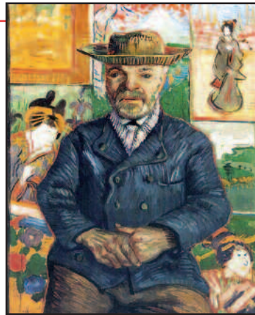
Vincent Van Gogh (1853-1890) Ritratto del padre

re amorevolezza, cura, allegria. Il vantaggio è che in una buona struttura, in cui avvenga anche il rispetto della personale privacy, l'ospite paga e ha diritto ad un servizio idoneo ai bisogni mutati derivanti dalla terza età avanzata. Da anni seguo una struttura di tale tipo in qualità di medico volontario e lo faccio consapevole di trovare un luogo con dei bisogni umani piuttosto forti. La titolare è una donna caratterialmente decisa, che conosce bene la psicologia dell'anziano. Ha impostato il lavoro sul rapporto personale e individualizzato. In qualsiasi condizione l'ospite si trovi, anche