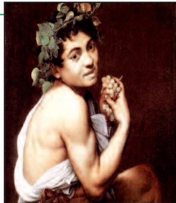
Caravaggio (1571 - 1610): Bacchino malato (part.)

La "salute" è diventata anche un affare, ammettiamolo. Trasmissioni televisive, carta stampata, luoghi diversi e disparati presentati adesso come salutari e ci riferiamo non solo ai centri di cura in senso classico, ma anche a esercizi commerciali che prima pubblicizzavano altro: saloni di bellezza trasformati in centri di medicina estetica, barbieri e parrucchieri adesso specialisti della cura del capello e della cute,