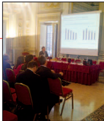
Un'immagine del convegno di Palermo

accrescere la sostenibilità del sistema sanitario regionale, portando la percentuale degli equivalenti a livelli europei (la media UE per il generico è del 50% sul totale dei farmaci dispensati con un picco pari all'80% in Gran Bretagna). in questo senso, non solo in Sicilia, ma, più in generale, nel nostro Paese, esiste un'arretratezza culturale che impedisce la diffusione del farmaco equivalente, un medicinale del tutto uguale al più noto farmaco di marca poiché contiene lo stesso principio attivo nella medesima quantità, nella stessa forma farmaceutica e via di somministrazione, garantendo la medesima efficacia