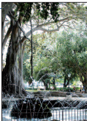
Un'immagine di Villa Garibaldi a Palermo

Centro Sociale Sant'Anna del quartiere Tribunale - Castellamare - Kalsa, il Centro Giovani di Borgo Nuovo e quello di via Fileti per il quartiere Montepellegrino. I restanti 21, invece, potranno utilizzare locali propri o presi in affitto, sempre all'interno del territorio della circoscrizione di riferimento. Le attività, di vario tipo (educative, laboratoriali, ludico-ricreative, teatrali, artistico-espressive e così via), sono rivolte a bambini e adolescenti dai 6 ai 18 anni e ai giovani dai 19 ai 24 anni. La gara per l'affidamento di ciascun centro sarà