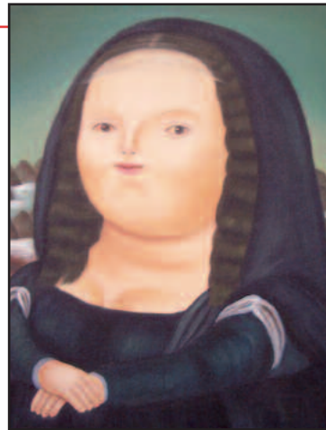
Fernando Botero (1932): Mona Lisa

Ma siamo davvero abituati a "sentirci"? In realtà, lo facciamo solo quando siamo vittime di un disturbo, perché ci toglie da uno stato di quiete. Così, riferiamo il nostro star bene ad un'assenza di maleseri o di disturbi. Se tiriamo una retta orizzontale che chiamiamo "zero", noi percepiamo tutto ciò che sta sotto lo zero, raramente ciò che sta sopra. Il benessere è tutt'altro: sta nell'area dallo zero in su, dalla quiete in su. Io sono perfettamente abilitato a