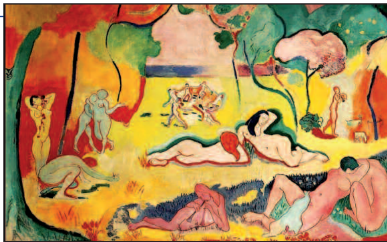
Henri Matisse (1869-1954): La gioia di vivere (part.)

Obiettivo? La felicità o, quanto meno, una serenità vera. Siamo tutti evolucionisti, cioè persone che non pensano ci si debba fermare mai nell'ambito delle conoscenze: siamo