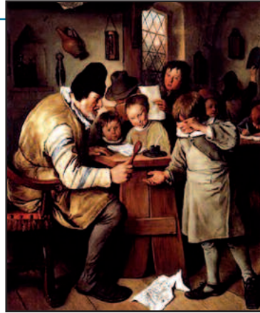
Jan Steen(1625 - 1679): A scuola (part.)

In teoria sarebbe quasi impossibile sbagliare; in pratica adesso si sbaglia per superficialità e non per ignoranza. Un'applicazione tecnologica urgente sarebbe proprio quel-