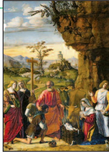
Cima da Conegliano: Adorazione dei pastori (part.)

Le mie personali ricerche mi portano ad affermare che è possibile perfino vivere senza farmaci - molti lo fanno. Adopero l'avverbio "perfino" perché quest'affermazione può sembrare un'eresia: è